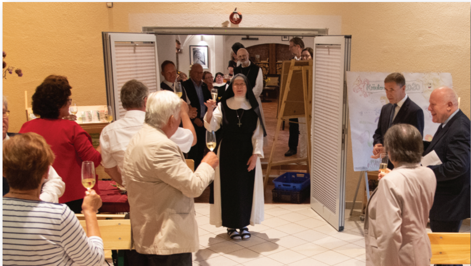
Ein Gläschen in Ehren... Das einzige Freundeskreistreffen 2020 fand aus Anlass des 60. Geburtstages der Äbtissin von St. Marienstern statt. Ein schöner Anlass in einer ansonsten eher schwierigen Zeit.

Schon sehr. 2020 – das erste Corona-Jahr – machte viele unserer Pläne zu nichts: Keine Mitgliederversammlung, kein Arbeitseinsatz, kein Ausflug. Lediglich ein Freundeskreistreffen aus Anlass des runden Geburtstages unserer Äbtissin im Sommer konnte stattfinden. Und 2021 sah es nicht viel besser aus: Wir planten Treffen und Veranstaltungen, und mussten sie dann doch wieder absagen. Nur einen Spaziergang durch den Lippe-Park zum Förderschulprojekt des Klosters in Schweinerden haben wir uns genehmigt. Fazit: Corona hat uns zwar an vielen Stellen in unseren Aktivitäten ausgebremst, aber die Gemeinschaft unseres Freundeskreises hat sich auch in dieser Zeit bewährt und als stabil erwiesen. Anders, als andere Vereine, haben wir keine Austritte zu verzeichnen gehabt.