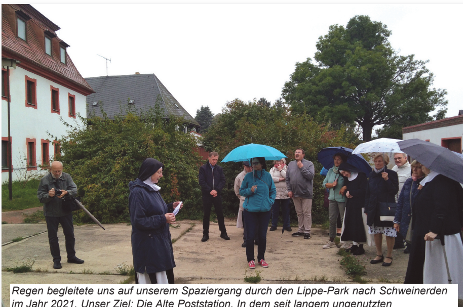
Regen begleitete uns auf unserem Spaziergang durch den Lippe-Park nach Schweinerden im Jahr 2021. Unser Ziel: Die Alte Poststation. In dem seit langem ungenutzten Gebäudekomplex möchte das Kloster eine Förderschule samt Therapiezentrum einrichten.